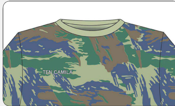
Identificação em camiseta camuflado