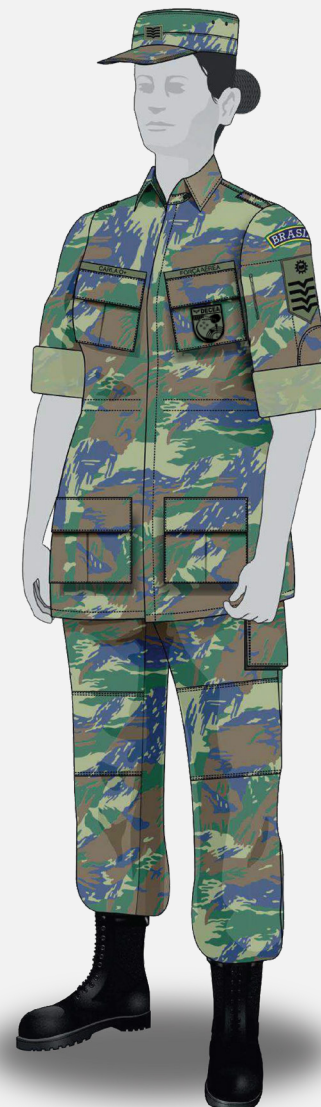
Gandola (manga dobrada)