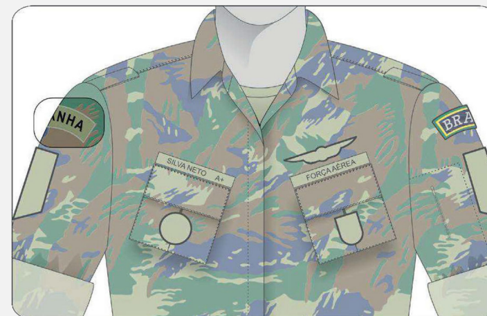
Posição dos distintivos de curso dístico

- Os distintivos do tipo dístico são usados a dez milímetros da costura do ombro da manga direita.