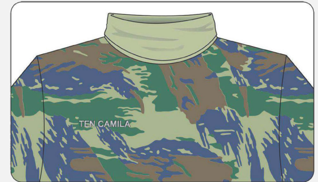
Identificação em blusão camuflado