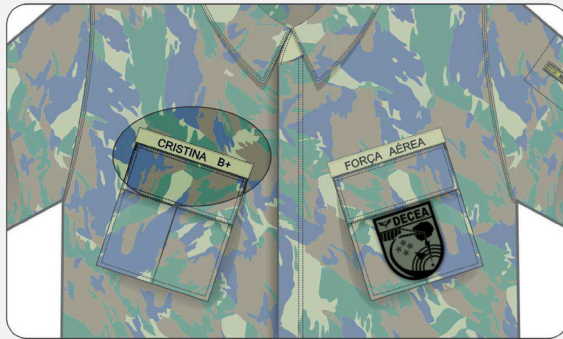
Posição da tarjeta em tecido de brim verde