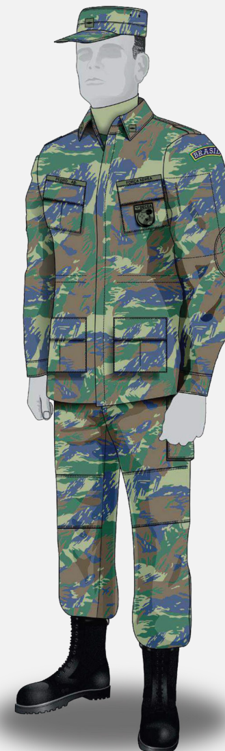
Gandola e as mangas esticadas